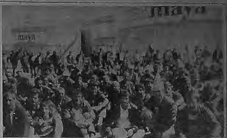
Toplu sözleşme görüşmeleri sürerken, fabrikanın kapatma ilanı ile karşılaşan Pakmaya işçileri "Bizler çalışmak istiyoruz. Bu kanunsuz lokavttır" diyerek fabrika önünde oturdular.

Grev erteleme olayı anti-demokratiktir. Devamı 9.sayfada